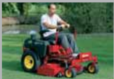
SRZ 15-27 HP