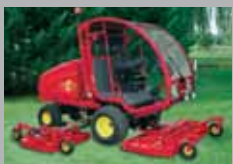
TURBO 6 - 6 FLAIL 60 HP