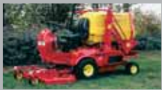
PG 20-30 HP