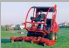
TURBO 5 50 HP