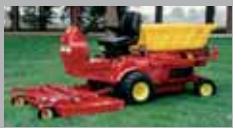
SR 20-30 HP