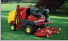
GT 22-30 HP