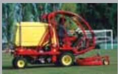
TURBO 1-1W-2-4 28-36 HP