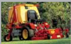
TURBOGRASS 20-22 HP